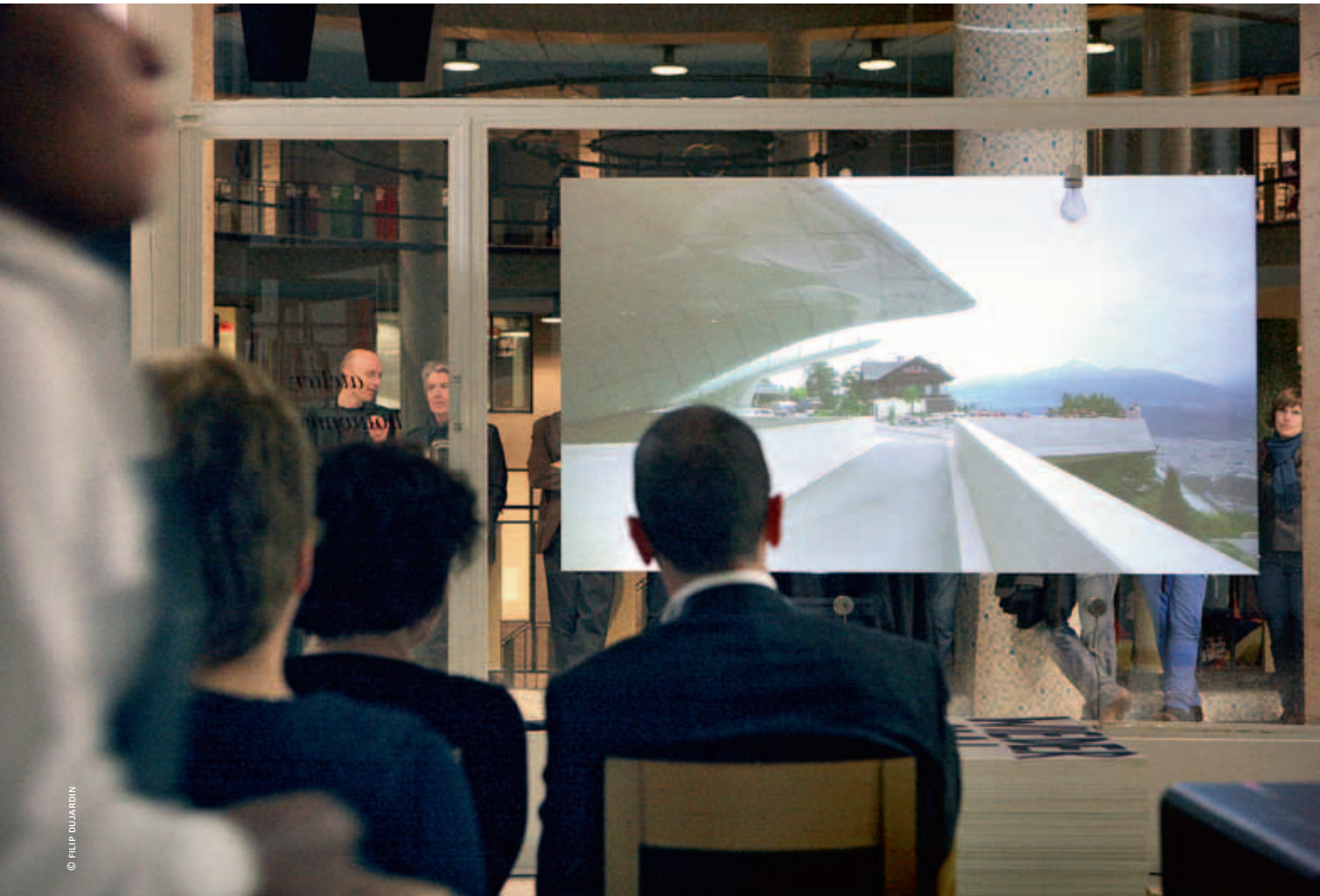
Atelier Bouwmeester, 14 december 2012