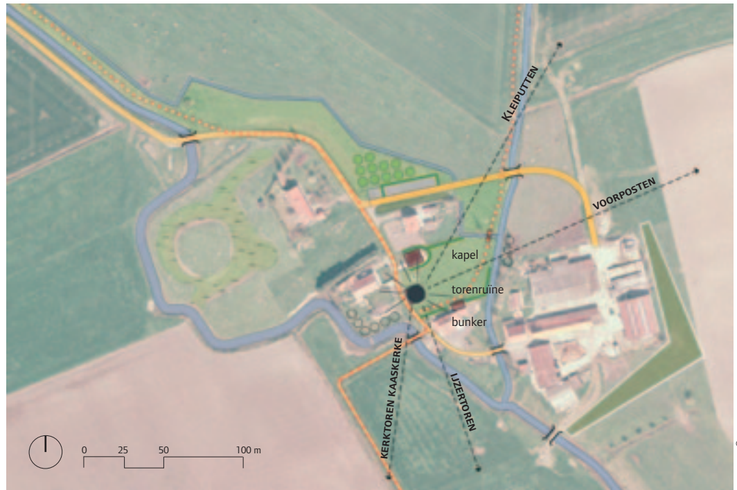
BASISBEELD © AGIV & PROVINCIE WEST-VLAANDEREN, OPNAME 2005

← De hoger gelegen punten in het vlakke landschap, zoals bijvoorbeeld deze molens, waren van strategisch belang in de oorlogsvoering. Vandaag bieden ze een mooi uitzicht op het landschap en inzicht in het verloop van de oorlog