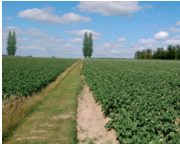
← Populieren markeren historische aanvoerroutes (render)

Aan de noordzijde van Ieper ligt de A19. Het voormalige niemandsland krijgt langs deze weg een markering met bomen. Tegelijk wordt hier een parking en uitkijkmogelijkheid ingericht als startpunt voor een wandel- en fietsroute langs belangrijke relictten uit de oorlog