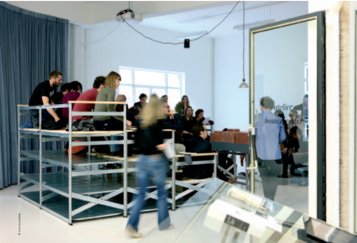
Atelier Bouwmeester, 12 juni 2012