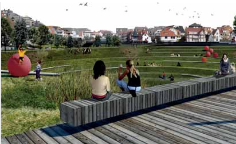
TV Orizon wil het Stübbenpark concentrisch uitgraven, en gooit het vrijgekomen zand bij elkaar tot een nieuwe duin op het strand