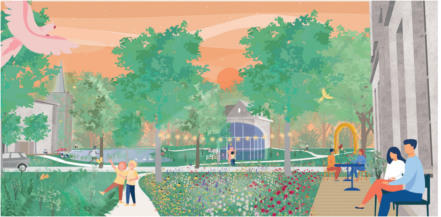
Plein Muizen-dorp LATER: een park-plein als poort naar de Dijle. (Voids Urbanism)

Het stadsbestuur wil inzetten op het versterken van de sociale cohesie, het herstellen van de verbinding met de open ruimte en een gezonde publieke ruimte op maat van de actieve weggebruiker.