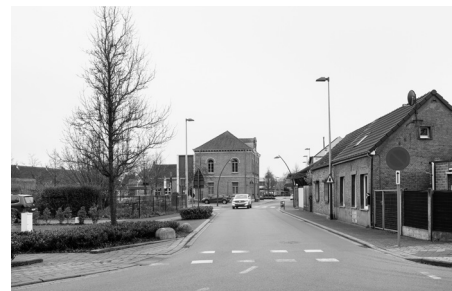
De Magdalenasteenweg doorkruist het dorp en ontvangt veel doorgaand verkeer.

Het oude centrum van Muizen, in het stedelijk randgebied van Mechelen, is wat ingedommeld en ondergaat de druk van de mobiliteitsassen in de buurt. Samen met de Muizenaar werkt het bestuur aan een toekomstvisie om het dorp levendiger te maken en de mobiliteit met gerichte ingrepen te verbeteren. De uitkomst is een methodiek waarmee de Stad straks ook in andere deelgemeenten aan de slag kan.