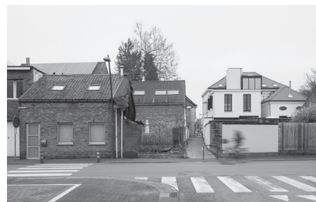
Het smalle Ruggebroodstraatje verbindt het plein Muizen-Dorp met het verhoogde dorpsplein.

worden. Omdat er op korte termijn geen middelen beschikbaar zijn om de dorpskern opnieuw aan te leggen, wenst het bestuur in de eerste plaats een globale visie uit te werken die de ruggengraat kan vormen voor een gefaseerde transformatie. Deze ambitieuze ruimtelijke ontwikkelingsstrategie moet ertoe leiden dat alle kleine en grote toekomstige projecten in het werkingsgebied binnen deze visie passen en zo bijdragen aan de realisatie ervan. Daarnaast wordt al een schetsontwerp opgemaakt voor de herinrichting van het dorpshart, gevormd door de twee pleinen en het Ruggebroodstraatje dat beide verbindt. Door middel van een participatief kunstproject komt er alvast een eerste tastbare realisatie in het dorpshart.