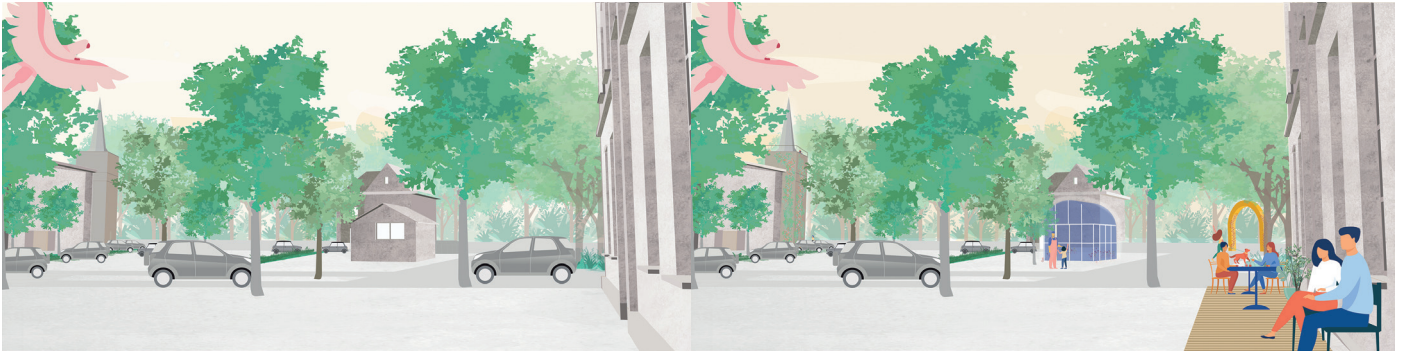
Plein Muizen-dorp NU.