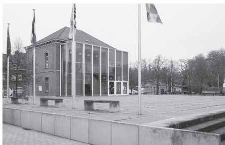
Het verhoogde dorpsplein tussen het dorpshuis en de school werd in 2009 aangelegd.