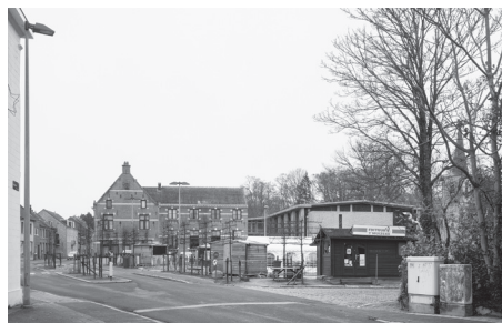
Het plein Muizen-Dorp aan de kerk wordt vandaag vooral gebruikt als parking.