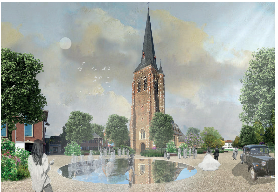
Het autovrije dorpsplein biedt nog steeds ruimte voor evenementen. (Overlant)

Als maximaal ontharde tuinstraat wordt de Kerkstraat een voortuin van het verblijfsgebied op de Markt.