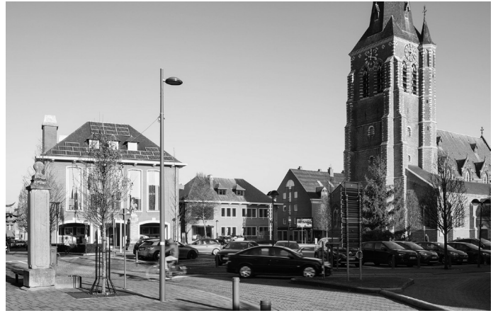
De markt doet vandaag dienst als parking en voelt meer als een verkeersknooppunt dan een centrumplein.

Het gemeentebestuur van Tessenderlo droomt van een klimaatrobuust en bruisend marktplein. De Looienaars komen er met de fiets of te voet naartoe om elkaar te ontmoeten. Met de inzet op een robuuste groene infrastructuur grijpt het ontwerpteam de kans om het groene imago van de gemeente ook in het centrum voelbaar te maken. De markt zal een stapsgewijze gedaanteverwisseling ondergaan tot een collectief, veelzijdig en groen centrumerf. Alle gebruikers worden in een vroeg stadium aangesproken om het ontwerp van het marktplein beter te maken.