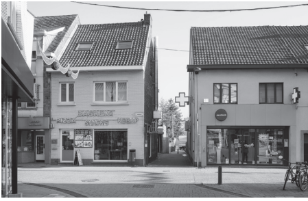
Smalle doorsteken verbinden de markt met de andere nabijgelegen centrumparkings.