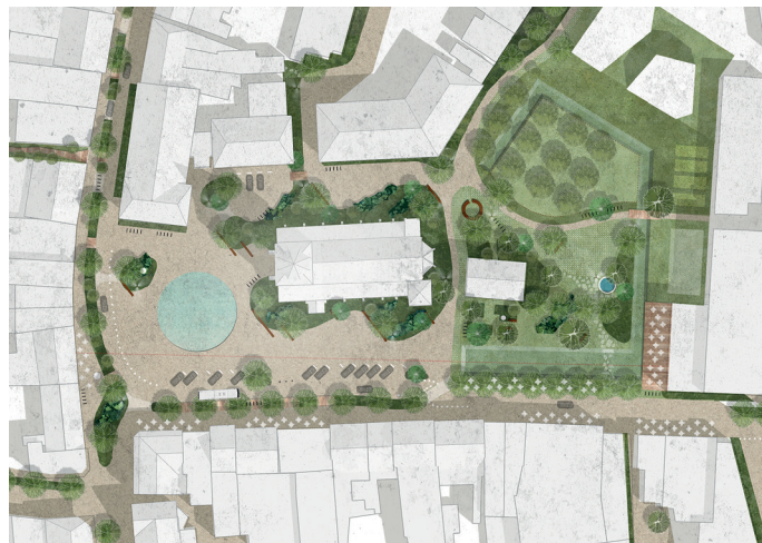
De markt transformeert van een verkeersknooppunt naar een collectief groen centrumerf. (Overlant)

De plannen van het gemeentebestuur om parkeren op het marktplein gefaseerd te laten uitdoven veroorzaken veel beroering. Markt- en kermiskramers vrezen dat bomen hun opstelruimte zullen inperken. Handelaars vrezen omzetverlies vanuit het idee dat ze minder bereikbaar zullen zijn. Tegelijk heeft Tessenderlo veel sleutels in handen om de verblijfskwaliteit van het marktplein te verhogen. Er is ruim voldoende parkeeraanbod in de directe omgeving, wat eerder uitzonderlijk is voor een gemeentekern. Volgens het bestuur kan de Markt enkel parkeervrij worden als er voldoende draagvlak is. Maar wat betekent dat: 'voldoende' draagvlak? Uit de burgerbevraging in het voorjaar van 2022 blijkt dat 39% van