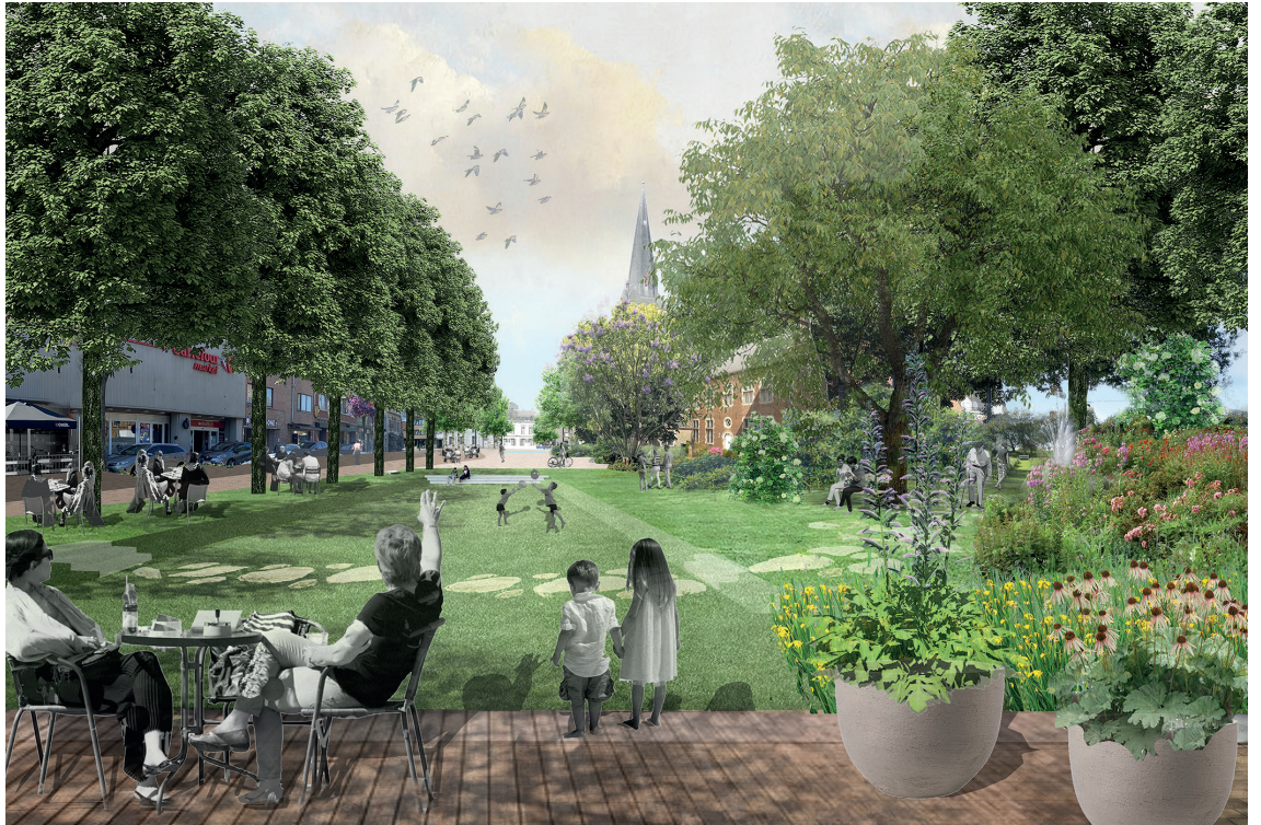
Het vroegere kerkhof en de pastortuin worden opnieuw verbonden en als dorpstuin ingericht. (Overlant)

Als maximaal ontharde tuinstraat wordt de Kerkstraat een voortuin van het verblijfsgebied op de Markt.