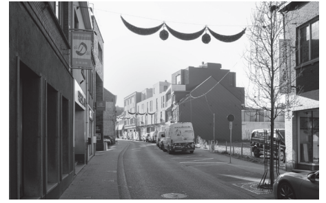
Verkeer naar de markt komt aan via de recent heraangelegde Neerstraat en Diesterstraat.