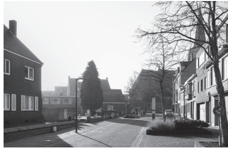
In de Kerkstraat bevindt zich de toegang tot de school.