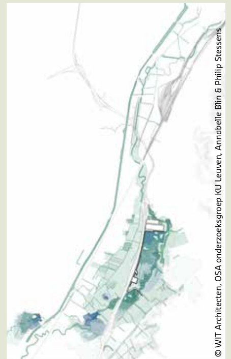
© WIT Architecten, OSA onderzoeksgroep KU Leuven, Annabelle Blin & Philip Stessens

“De uitdaging bestond erin om de gewestgrenzen los te laten en na te denken over de ontwikkelingsmogelijkheden van het grotere geheel”