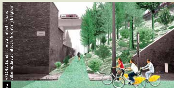
© LOLA Landscape Architects, Floris Alkemade Architect &amp; Grontmij Belgium