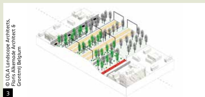
© LOLA Landscape Architects, Floris Alkemade Architect &amp; Grontmij Belgium