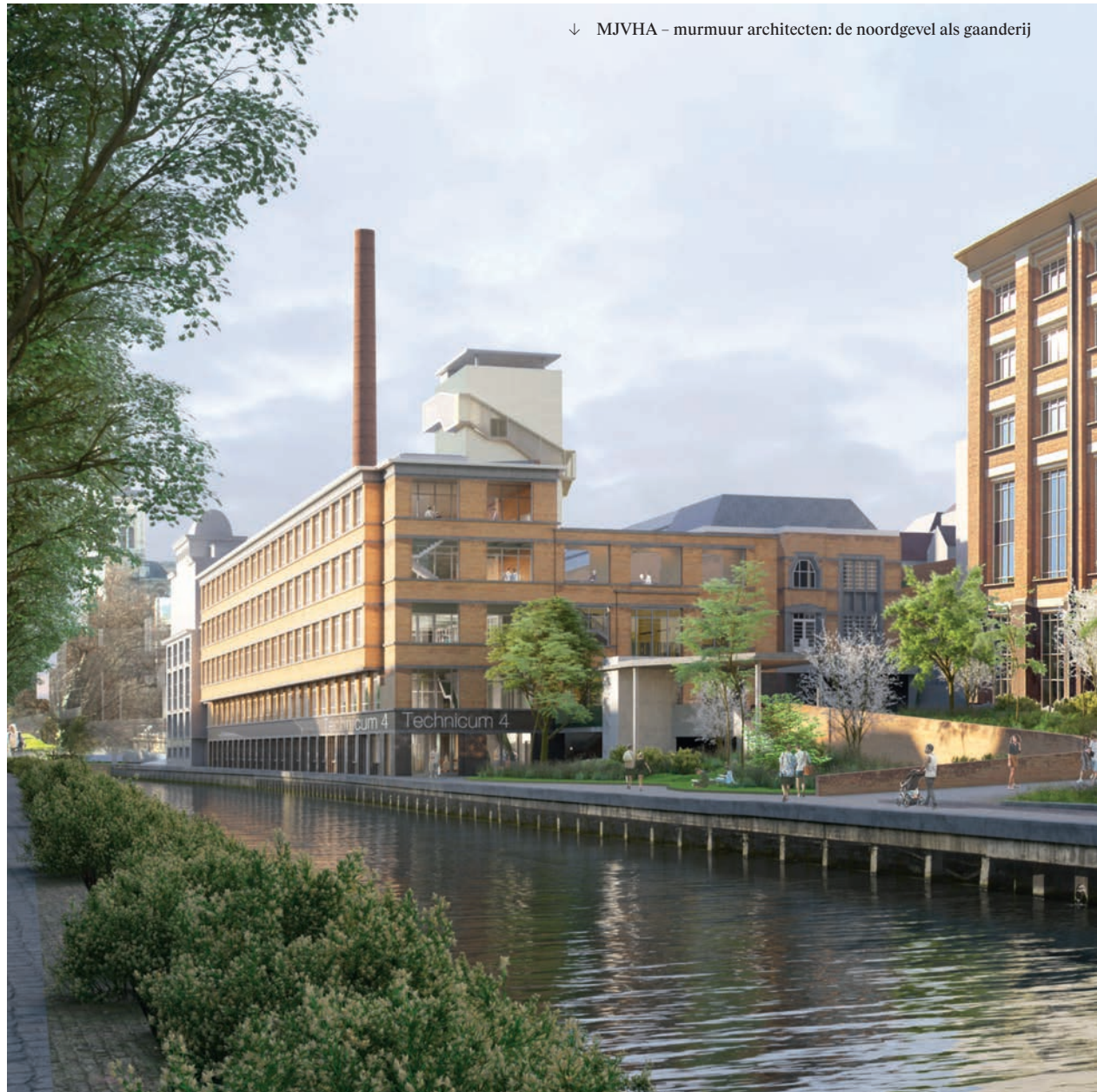
↓ MJVHA – murmuur architecten: de noordgevel als gaanderij