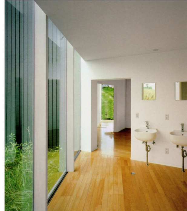
Sou Fujimoto Woonzorgcentrum, Hokkaido, Japan