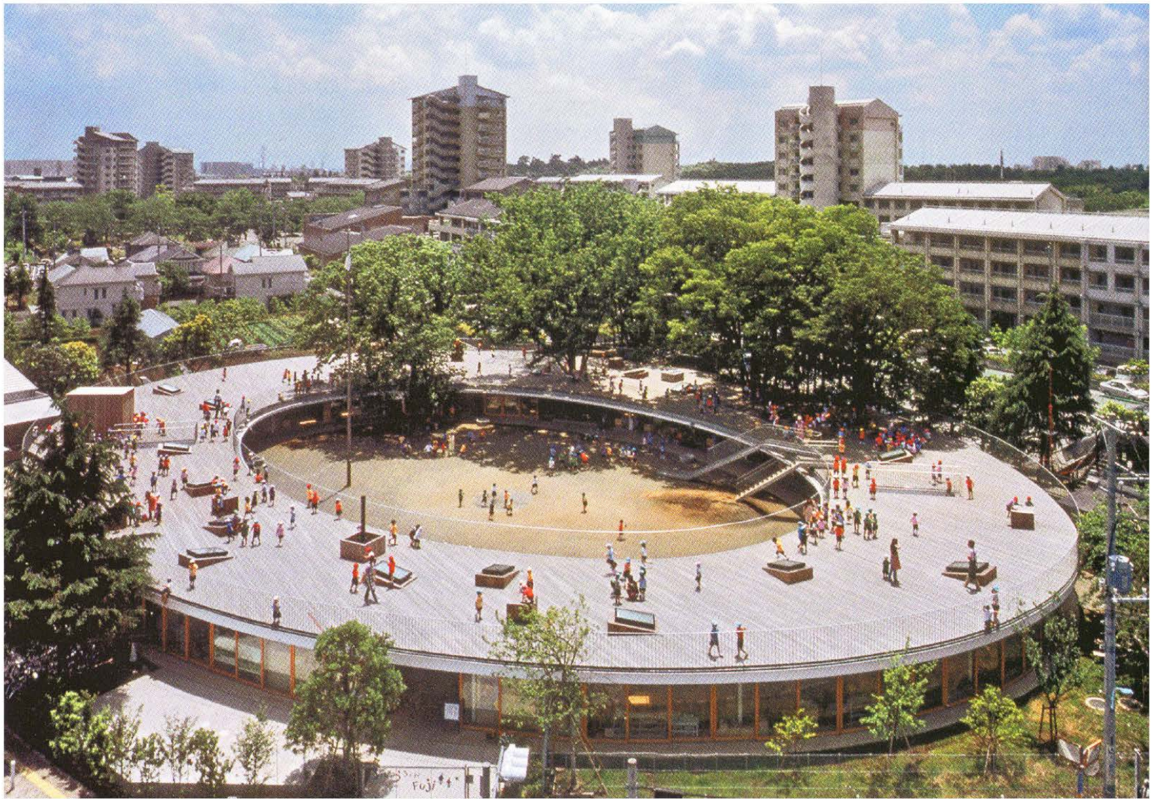
Tezuka Architects Kleuterschool, Tachikawa, Tokio, Japan