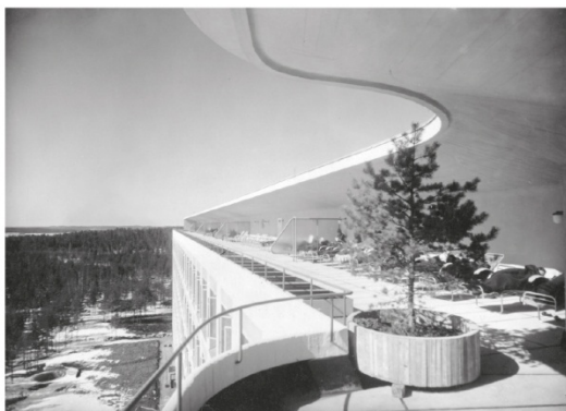
Sanatorium Paimio, Finland (arch. Alvar Aalto, 1932)

dringt zich op binnen de sociale huisvesting. De gekende concepten zijn niet langer van deze tijd, bijbenen zal niet volstaan. Men moet inzetten op innovatie binnen de sector, concepten durven oprekken, buiten de plat - getreden paden treden en nieuwe regels bedenken, regels die ruimtelijke vrijheid in de hand werken, eerder dan sociaal isolement.