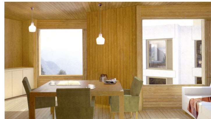
Sergison Bates architects Verzorgingstehuis, Visp Zwitserland