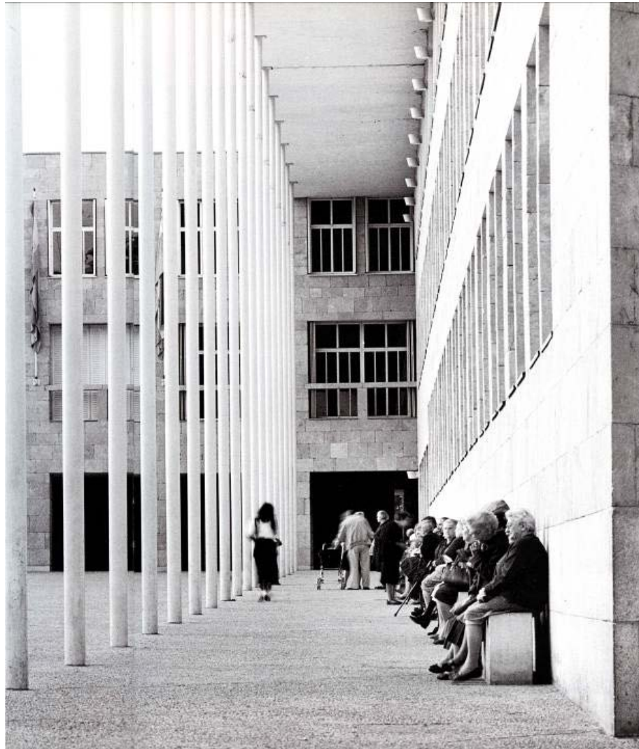
Rafael Moneo Stadhuis, Logroño