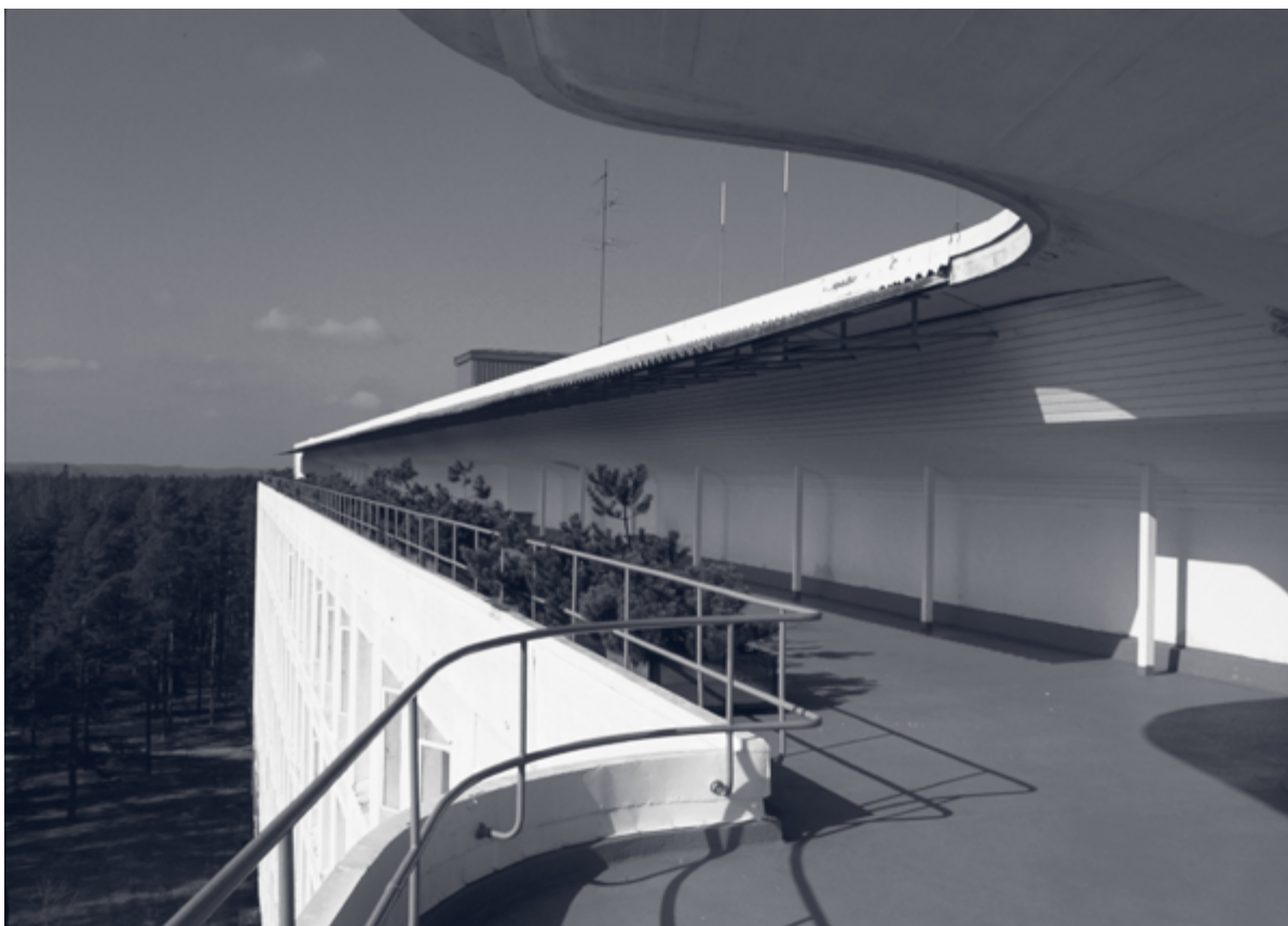
Alvar Aalto Sanatorium, Paimio.