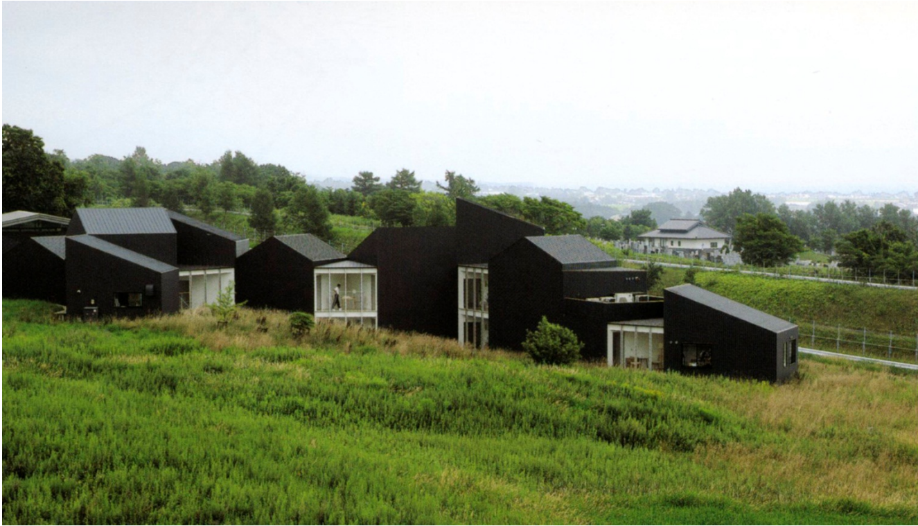
Sou Fujimoto Woonzorgcentrum, Hokkaido, Japan