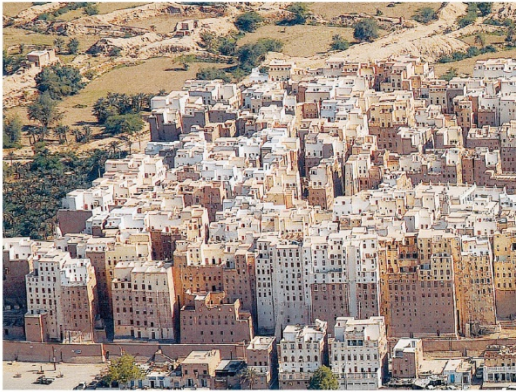
Shibam, Wadi Hadhramaut, Jemen

Tegen 2050 zullen er in België twee miljoen zestigplussers méér zijn dan in 2010. Het aantal tachtigplussers zal dan verdrievoudigd zijn. Bij een ongewijzigd beleid zou dit 180.000 extra woon- en zorgplaatsen betekenen tegen 2050, verzorgd door 120.000 extra personeelsleden.*