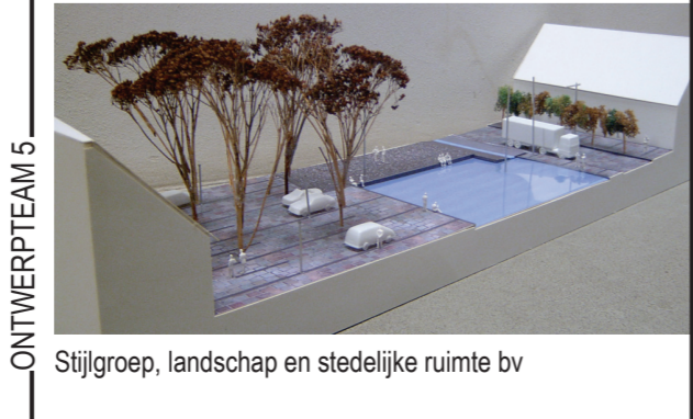
Stijlgroep, landschap en stedelijke ruimte bv