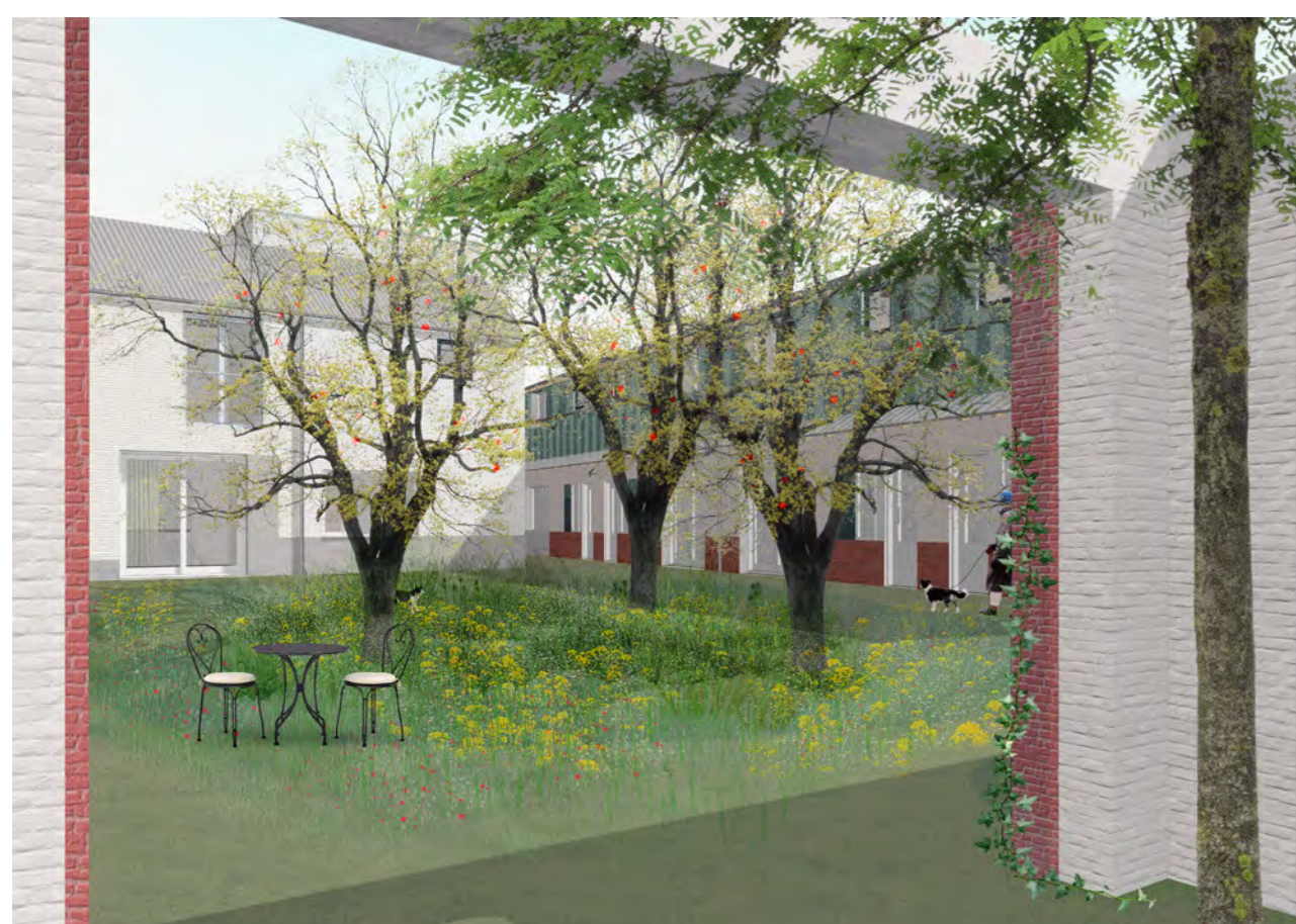
Het collectieve binnengebied van de hoeve wordt ingevuld met een boomgaard en hooiland. De buitenkamers in de oude stallen zijn plekken voor ontmoeting en ontspanning.