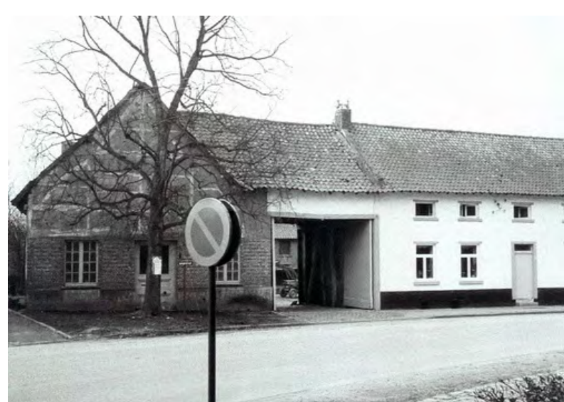
Historische foto van de hoeve uit 1975.