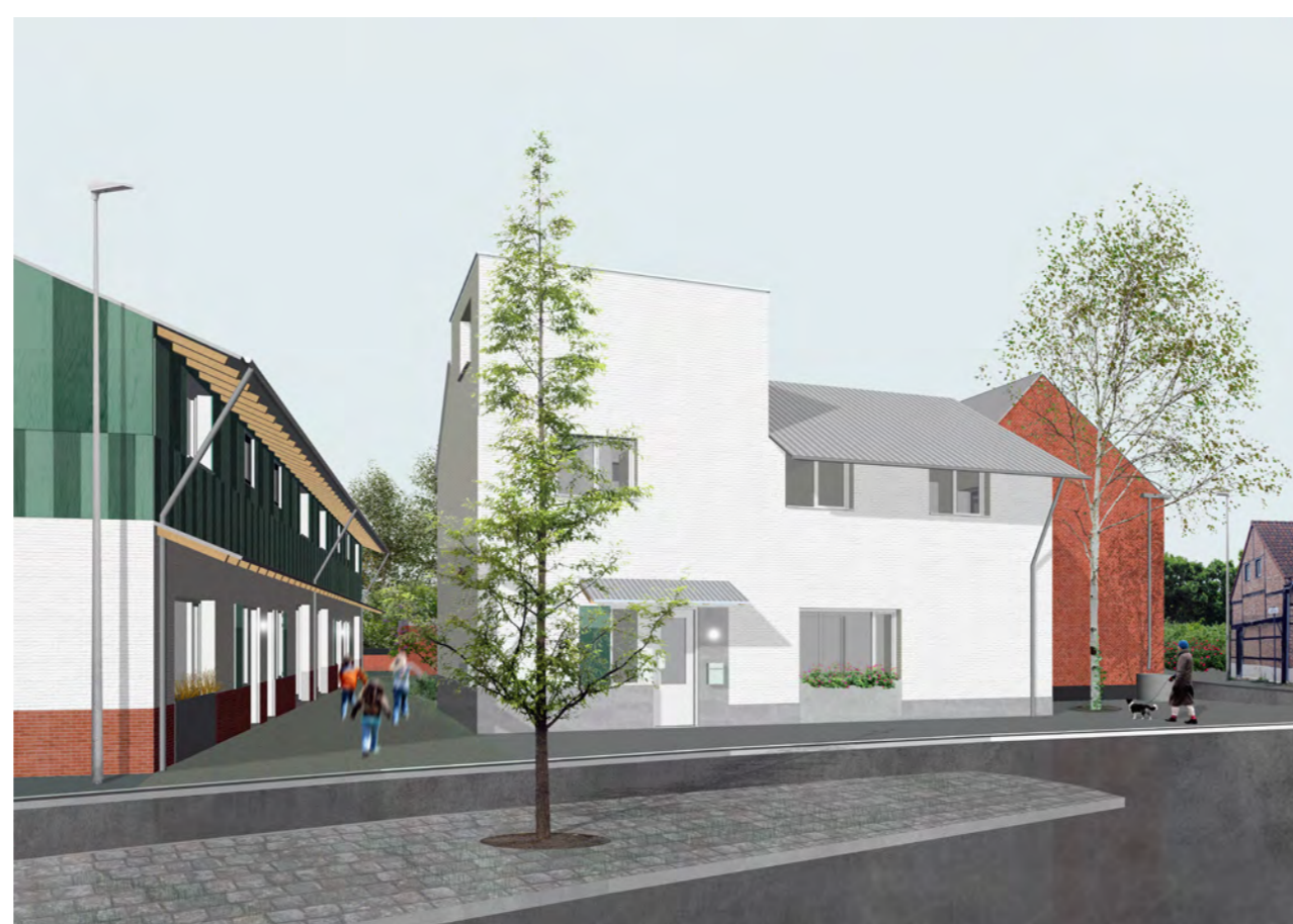
De hoofdtoegang tot het binnengebied tussen het woonhuis en de woonschuur. De gekleurde gevelbekleding in hout vrolijkt het geheel op geeft het ontwerp persoonlijkheid.