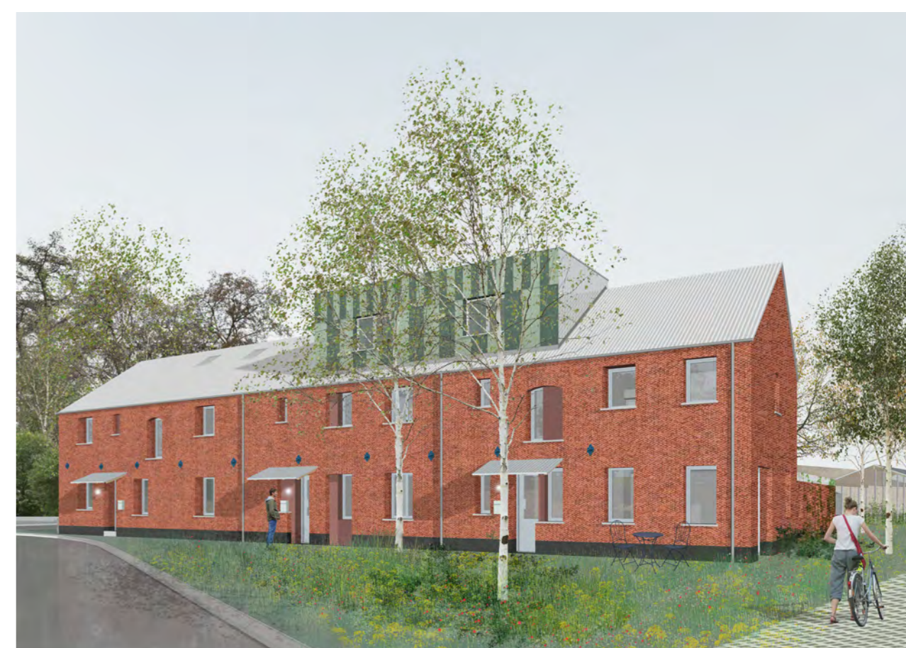
De geleefde noordvleugel met een een dubbele dakkapel en luifels boven de inkomdeuren.