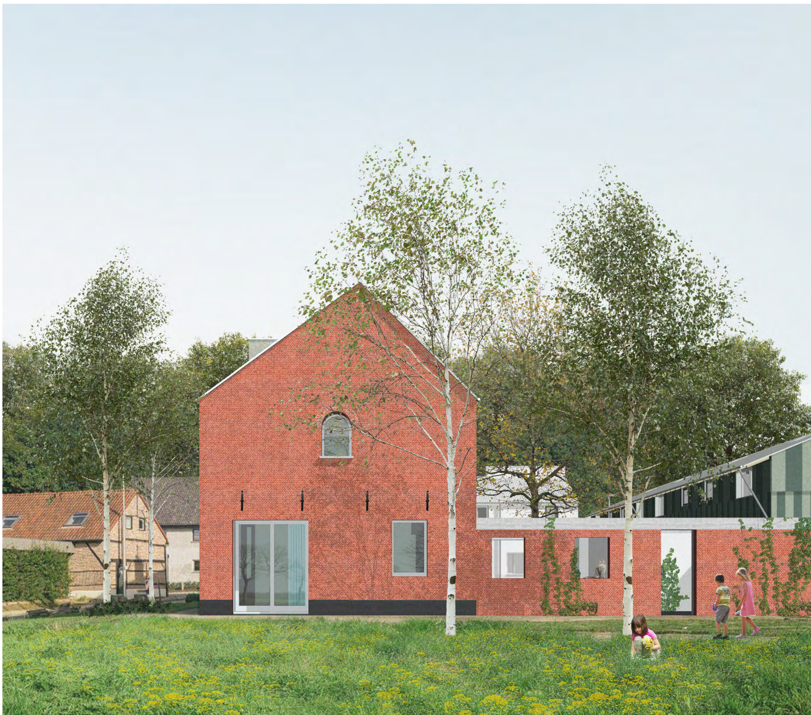
De westgevel van de bestaande hoeve wordt gerenoveerd. De oude stallen maken deel uit van de tuin in de vorm van collectieve buitenkamers, bergingen en zitplekken.