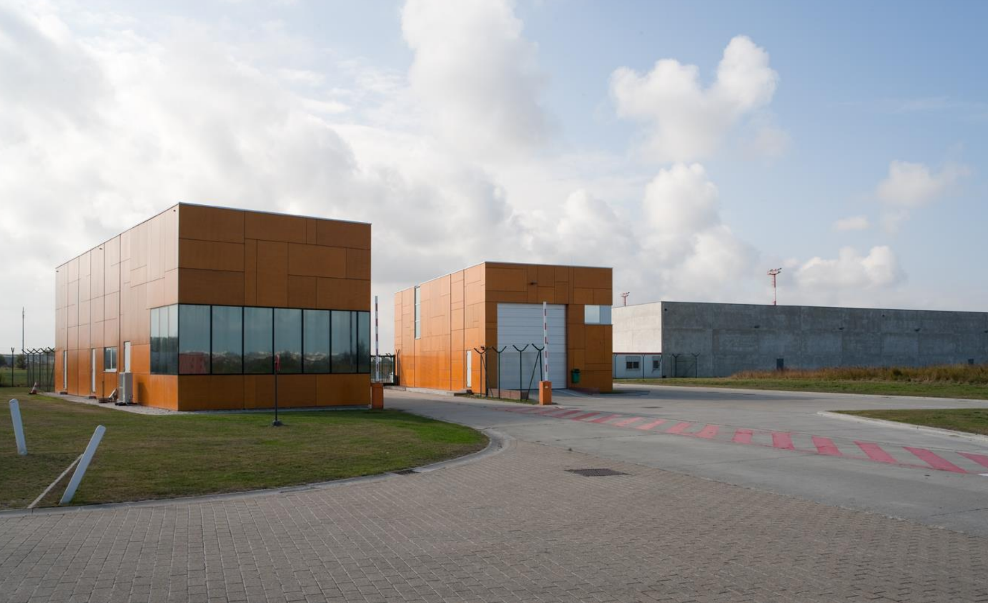
MEESTERPROEF 1999 WACHTPOST LUCHTHAVEN, OOSTENDE Tijl Vanmeirhaeghe